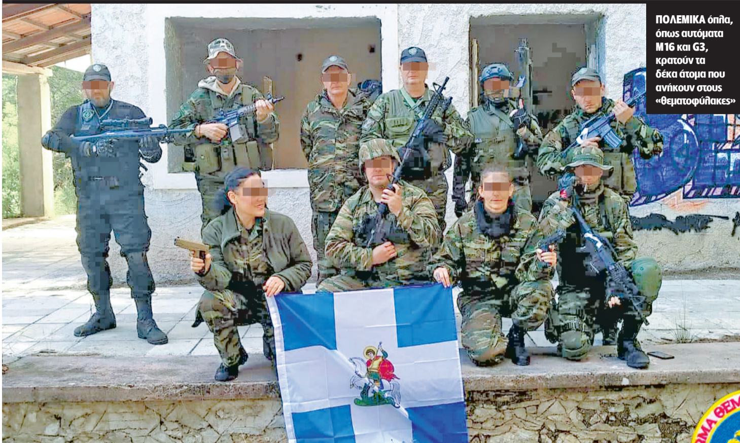
ΠΟΛΕΜΙΚΑ όπλα, όπως αυτόματα M16 και G3, κρατούν τα δέκα άτομα που ανήκουν στους «θεματοφύλακες»